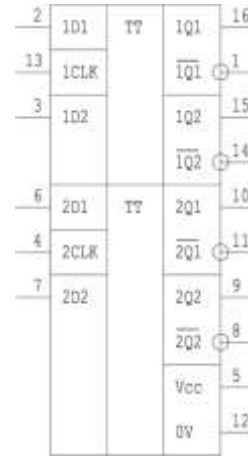
Таблица назначения выводов